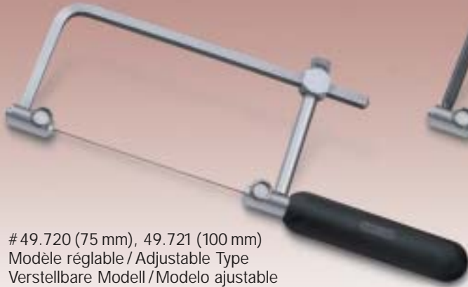
# 49.720 (75 mm), 49.721 (100 mm) Modèle réglable / Adjustable Type Verstellbare Modell / Modelo ajustable