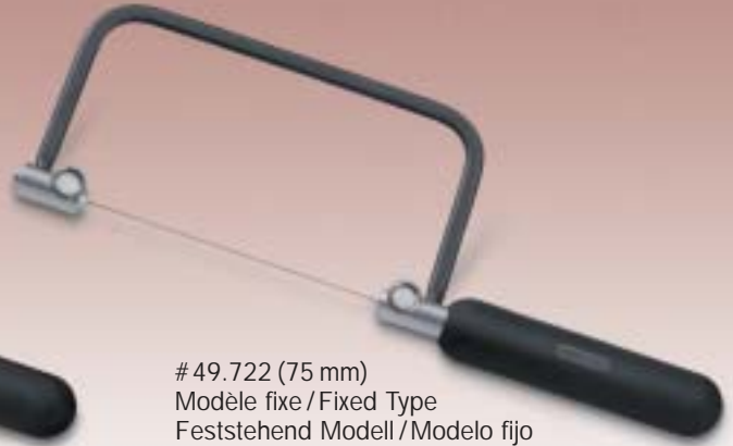
# 49.722 (75 mm) Modèle fixe / Fixed Type Feststehend Modell / Modelo fijo